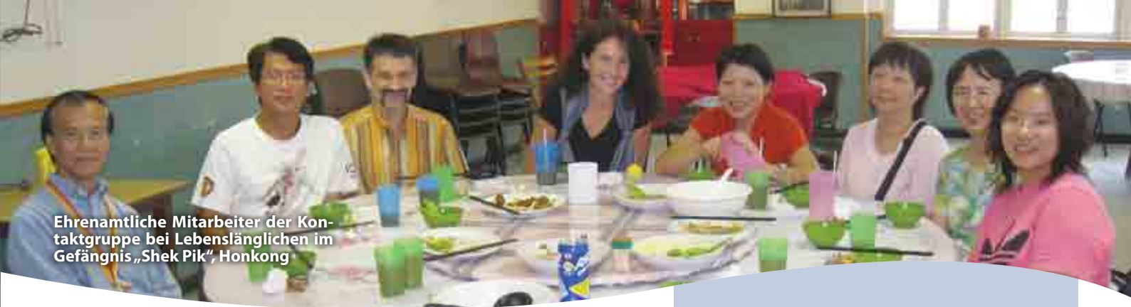
Ehrenamtliche Mitarbeiter der Kontaktgruppe bei Lebenslänglichen im Gefängnis „Shek Pik“, Hongkong