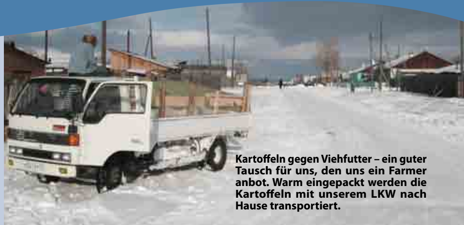
Kartoffeln gegen Viehfutter – ein guter Tausch für uns, den uns ein Farmer anbot. Warm eingepackt werden die Kartoffeln mit unserem LKW nach Hause transportiert.