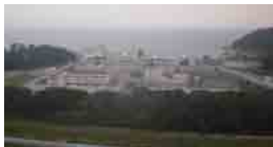
Das Gefängnis „Shek Pik“ auf der Insel Lantau

An einem Sonntag im September besuchten wir zum ersten Mal das Gefängnis „Shek Pik“ für Lebenslängliche auf der reizvollen Insel Lantau. Maximal zehn Ehrenamtliche werden zu