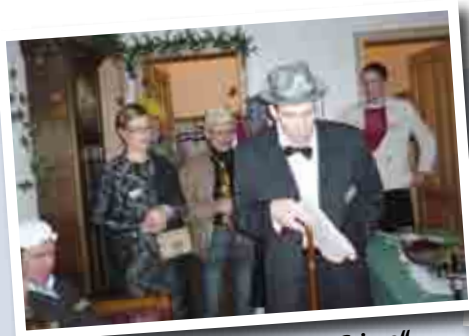
Silvesterabend mit „Dinner & Crime“

Besuchen Sie unsere neue Homepage und erfahren Sie Neues über das „Familiengut Wendorf“: www.familiengut.de