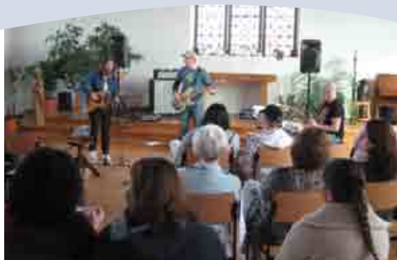
Konzert bei den Frauen in der JVA Willich II