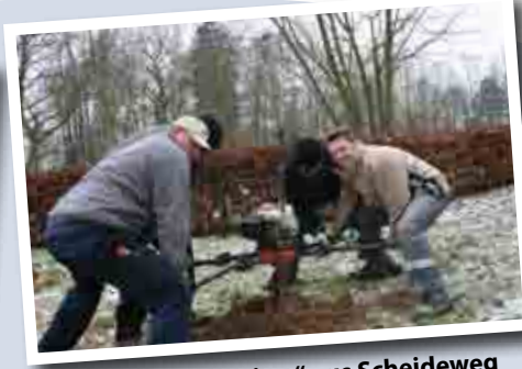
Fleißige „Gastarbeiter“ aus Scheideweg