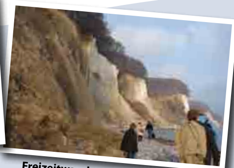
Freizeitwanderung auf der Insel Rügen