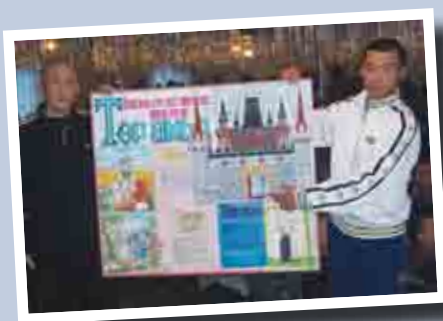
Gefangene in Awterant gestalteten ein Bild zum Thema „Glauben“. Die Themen sind deutlich zu erkennen: „Der gute Hirte“, „Auferstehung“ und „Taufe“. Das Bild Gottes als guter Hirte und als ein lebendiger Gott scheint ihnen wichtig zu sein.