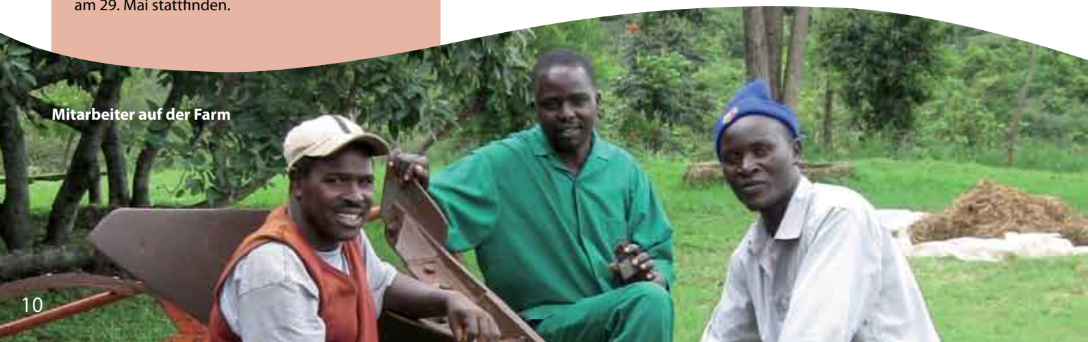
Mitarbeiter auf der Farm