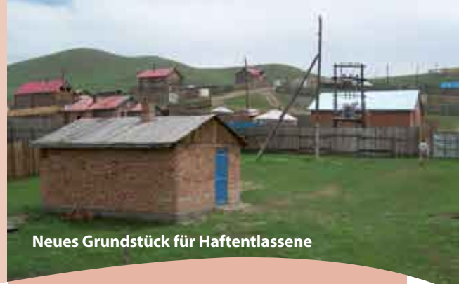
Neues Grundstück für Haftentlassene