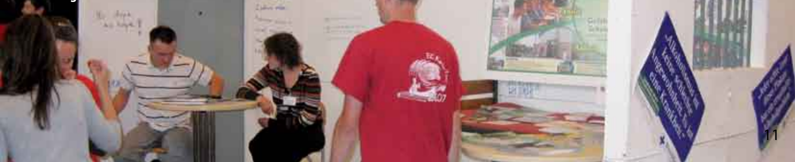
Gefängniszelle auf der Allianzkonferenz

Weitere Infos unter www.weisses-kreuz-hilft.de