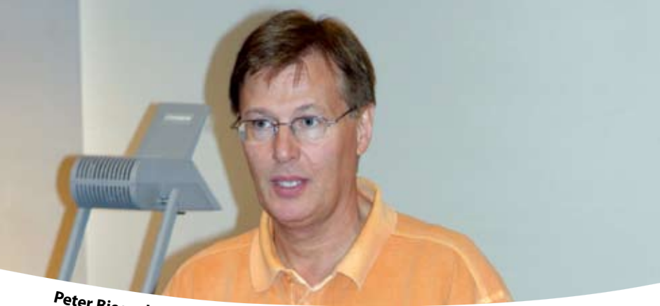
Peter Biesenbach MdL

spielen im Vollzug Verurteilungen wegen Betäubungsmittelverstoßen noch eine sehr untergeordnete Rolle. Der Anteil der Gewalt- und Straßenverkehrtsdelikten im Zusammenhang mit exzessivem Alkohol -konsum ist dagegen hoch.