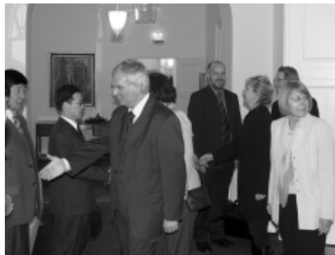
Begegnungen im Deutschen Bundestag

Seit 1992 sind wir in der mongolischen Hauptstadt Ulaanbaatar engagiert. Seitdem hat sich vieles verändert: Die Tuberkulose unter den Gefangenen und insbesondere tuberkulosebedingte Todesfälle wurden deutlich zurückgedrängt. Die Arbeitsbetriebe im Strafvollzug, die nach der Wende fast völlig zusammenbrachen, gewinnen wieder an Bedeutung. Im Strafvollzug wird Sozialarbeit eingeführt, die Integration Haftentlassener wird zu einer Aufgabe der Anstalten. Die