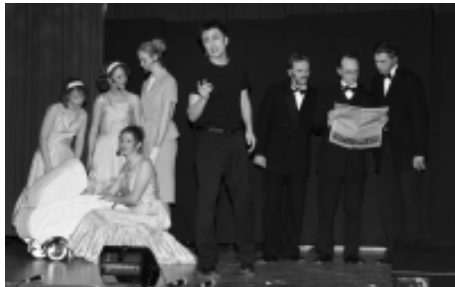
Kai und seine Nachbarn

Das Musical erzählt von Kai: Er ist ein Kind der Nachkriegszeit. Seine Eltern sind beruflich erfolgreich und schicken ihn auf ein privates Gymnasium. Doch dann lernt Kai im Milieu der Großstadtkneipen eine andere Welt kennen: Mädchen, Autos, schnelles Geld. Die Fassade der bürgerlichen Welt beginnt zu bröckeln ... Im Frühjahr 2004 wurde „Bastard“ uraufgeführt. Aufgrund der großen Nachfrage ging das Musical jetzt ins zweite Jahr: Bastard - die Geschichte eines Aussteigers, Porträt einer Generation zwischen Wirtschaftswunder, Drogenkultur und dem Traum von einer besseren Welt. Ein Musical, das hinterfragt, betroffen macht, aber auch Antworten gibt. Kaum einer könnte diese Geschichte überzeugender nachzeichnen als der „Teestubenchor“ der Gefährdetenhilfe Scheideweg. Ein außergewöhnlicher Chor - viele seiner Mitglieder waren inhaftiert, drogenabhängig, haben extrem gelebt oder sind auf der Suche nach „Leben“ gescheitert. Im Musical berichteten sie von dem, was sie erlebt haben und von ihrem Glauben an Gott als Perspektive und Herausforderung für alle Menschen. Viele Gespräche auch nach dem Musical zeigten, dass über diese Themen großer Gesprächsbedarf besteht.