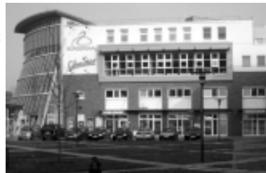
Bürgersaal in Waren (Müritz)

Die Anmeldefrist für das Internationale Gefährdetenhilfeforum vom 27. bis 30. Oktober 2005 in Waren (Müritz) hat begonnen. Gastgeber in diesem Jahr ist die Gefährdetenhilfe Waren gGmbH (Müritz-Kreis). Zum 20ten Mal werden die Mitglieder und Freunde der „Bundesarbeitsgemeinschaft seelsorgerlich-diakonischer Gefährdetenhilfen (BSDG)“ und der „International Association of Christian Counselling and Charitable Prison and Rehabilitation Ministries“ (IACPR) für mehrere Tagen zusammentreffen. Eine lebendige Gemeinschaft, der Erfahrungsaustausch, Einblicke weit über die Grenzen der eigenen Arbeit hinaus und das Gespräch zu aktuellen Entwicklungen und Grundsatzfragen seelsorgerlich-diakonischer Arbeit bilden den Mittelpunkt der Tagung. Wir erwarten Gäste und Repräsentanten von Gefährdetenhilfevereinen aus (Ost-)Europa, Asien, Afrika und Amerika. Tagungsstätte ist der Bürgersaal im Zentrum der Müritz-Stadt Waren. Übernachtungsmöglichkeiten bieten das Gutshaus „Schloß Wendorf“ und die Europäische Akademie Waren. Vor der Konferenz bietet das Gutshaus Schloss Wendorf „Tage der Erholung“ in der naturreichen Landschaft der Mecklenburgischen Seenplatte an. Weitere Informationen und Anmeldeformulare gibt es auf unserer Website www.gefahrdetenhilfe.de oder können in unserem Büro angefordert werden.