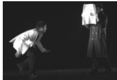
auf der Flucht