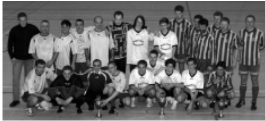
Die Siegermannschaften aus Remscheid und Scheideweg

wie er mit Gottes Hilfe einen Neuanfang schaffte. Froh waren die Gastgeber, dass auch das Wetter mitspielte: Der für Samstag angekündigte Wintereinbruch hätte die Teilnahme der Mannschaften aus Hemer und Siegburg verhindert.