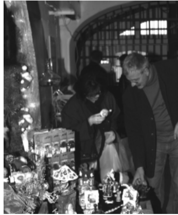
Unser Verkaufsstand in der JVA Remscheid

An jedem zweiten Dienstagabend besucht eine Gruppe von etwa 15 Ehrenamtlichen das Gefängnis und bietet nach einem gemeinsamen Start mit Liedern und einer Andacht die Gelegenheit zu persönlichen, seelsorgerlichen Gesprächen.