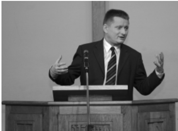
Hermann Gröhe MdB