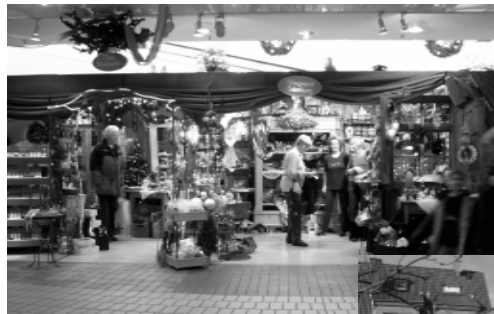
Unser Weihnachtsstand im Alleecenter in Remscheid

Seit Anfang November ist die Advents- und Weihnachtsausstellung im Pflanzenpark eröffnet. Zusätzlich haben wir seit dem 23. November einen Verkaufsstand im Alleecenter in Remscheid. Wir freuen uns auf jeden Besuch!