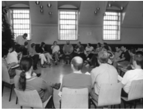
Kontaktgruppe in der JVA Bochum

Liebe Freunde, für die Unterstützung unserer Arbeit im vergangenen Jahr danken wir von ganzem Herzen. Wir wünschen allen ein frohes Weihnachtsfest und Gottes Segen für das Jahr 2005!