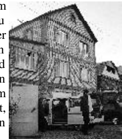
Das Haus der Gefährdetenhilfe in Ulan Ude