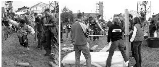
Weitsprung und Hochsprung beim „Spiel ohne Grenzen“