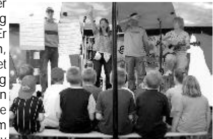
Kinderstunde in Möllenhagen