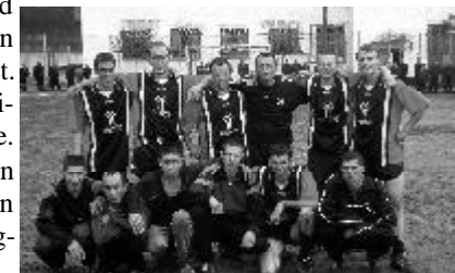
Sportliche Begegnung im Gefängnis