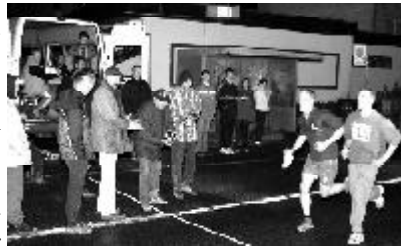
Zieleinlauf beim Mitternachtslauf

Ein Höhepunkt der diesjährigen Veranstaltung ist der Mitternachtslauf in der Nacht von Samstag auf Sonntag. Die