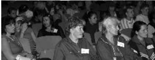
Besuche in Gefängnissen in Riga: Begegnungen mit Jugendlichen (oben) und Frauen hinter den Mauern.