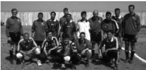
Fußballspiel gegen eine Gefängnis-Mannschaft

lung mongolischer Vollzugsmitarbeiter in Ulaanbaatar stieß auf großes Interesse: Zusammengekommen waren Sozialarbeiter des mongolischen Strafvollzuges aus dem ganzen Land sowie Vertreter der Vollzugsleitung. Klaus Hübner und Wolfgang Wermke wiesen in ihren Vorträgen darauf hin, dass der gesamte Strafvollzug und insbesondere auch der allgemeine Vollzugsdienst an der Behandlung der Gefangenen mitwirken. Friedel Pfeiffer betonte die Möglichkeiten ehrenamtlicher Mitarbeiter, vertrauensvolle und über die Haftentlassung hinausreichende Beziehungen zu Gefangenen aufzubauen.