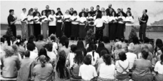
Programm im Frauengefängnis in Kalocsa