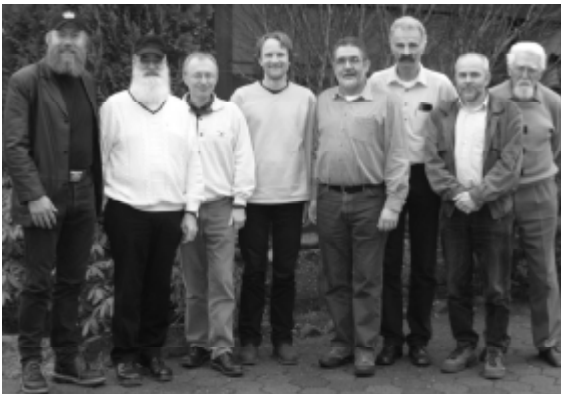
Die Mitglieder des BSDG- Vorstands

Der BSDG-Vorstand traf sich auf dem „Hofgut Begegnungen“ der Gefährdetenhilfe Breitscheid e.V. (Westerwald): Auf diesem Bauernhof werden straffällige junge Menschen in der Landwirtschaft angeleitet und ausgebildet. Als zusätzliche Angebote werden auf dem Hofgut eine Schreinerei, ein Cafe, ein Pfadfinderlager sowie ein Lama-Tracking vorgehalten.