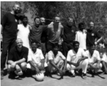
Nach einem Volleyballspiel gegen die „Knast“-Mannschaft