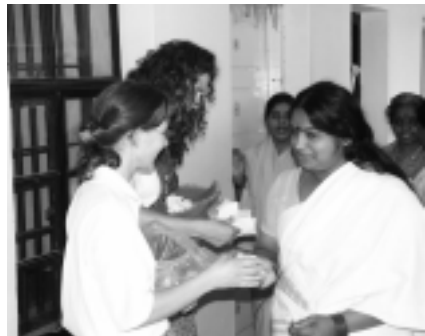
Weibliche Gefangene erhalten Plätzchen und Literatur

will die Gefährdetenhilfe Scheideweg einen Kurs für (ehrenamtliche) Mitarbeiter im Strafvollzug in englischer Sprache herausgeben und den indischen Partnern zur Verfügung stellen. Indischen Nachwuchsführungskräften aus Strafvollzug und Straffälligenhilfe sollen - in Zusammenarbeit mit den deutschen Strafvollzugs-