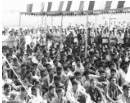
Veranstaltung im Zentralgefängnis Bangalore