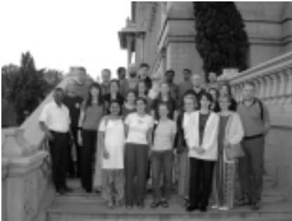
Unsere Reisegruppe vor dem Landtag in Bangalore