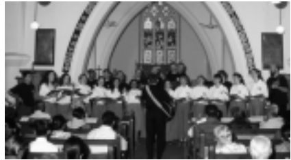
Konzert in einer Südindischen Kirche