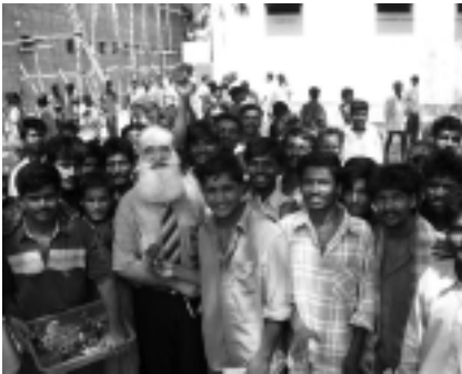
Persönliche Begegnung mit Gefangenen