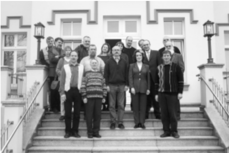
Justizminister Erwin Sellering (mittlere Reihe, 2. v. r.) mit Teilnehmern der Regionalkonferenz

Die Konferenzteilnehmer traten mit dem Vorschlag an den Justizminister heran, eine Broschüre über den Strafvollzug in Mecklenburg-Vorpommern zu erstellen, die auch die Bereiche Gefängnisseelsorge und Ehrenamt umfasst. „Ehrenamt im Strafvollzug ist unverzichtbar“, betonte der Minister und dankte den Seelsorgern für ihre wichtige Arbeit. „Dieser Tätigkeit will ich Unterstützung und den nötigen Rückenwind vermitteln“, so Erwin Sellering. Er sprach sich dafür aus, den Austausch zwischen Gefängnisseelsorgern und Justizministerium in Zukunft regelmäßig und auf geeignete Weise fortzusetzen.