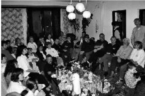
Besuch der Wohngemeinschaft in Dunakeszi

gelegen, war unser Ausgangspunkt für die geplanten Einsätze. Etwa 1500 km haben wir in Ungarn mit dem Bus zurückgelegt, um Programme in verschiedenen Gefängnissen für Männer und Frauen sowie in einer Jugendstrafanstalt durchzuführen. Mit Liedern in ungarischer Sprache, Theaterstücken, persönlichen Lebensberichten und Kurzbotschaften konnten wir die Nachricht von der Liebe Gottes zu den Gefangenen bringen. Manche skeptischen Augen wurden weich und voller Tränen, Hoffnungslosigkeit wich Hoffnung. Besonders beeindruckend waren unsere Besuche in den Frauengefängnissen. Viele der inhaftierten Frauen waren vom Leben gezeichnet, ihrem Alter nach hätten sie unsere Mütter sein können, wir erfuhren, dass ein großer Teil von ihnen wegen Mord inhaftiert ist. Sie haben unser Programm und die Lebensberichte, die wir ihnen weitergaben, wie trockene Schwämme aufgesogen. Ihre Dankbarkeit für unseren Besuch brachten sie dadurch zum Ausdruck, dass sie uns kleine selbst gebastelte Püppchen schenkten. Neben den Einsätzen in den Gefängnissen hatten wir die Gelegenheit, in Dunakeszi die Wohngemeinschaft der Gefährdetenhilfe „Stiftung Lebendige Hoffnung“ zu