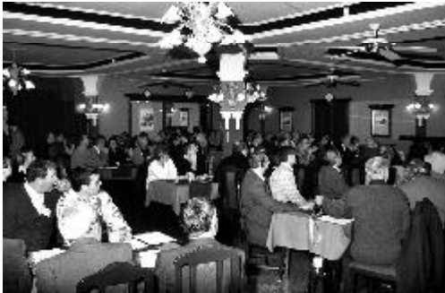
Teilnehmer im Konferenzraum in Visegrád