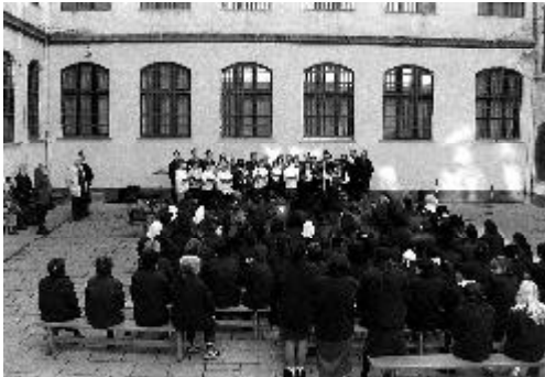
Im Frauengefängnis in Kalocza

Vom 16. bis 27. Oktober waren wir mit einer Gruppe von 40 Personen aus unterschiedlichen Gefährdetenhilfen in Ungarn unterwegs. Nach einer 17-stündigen Busfahrt erreichten wir unser Quartier im „Biblia Centrum“ in Dömös und wurden von unseren ungarischen Freunden herzlich mit einem leckeren Mittagessen empfangen. Dömös, am wunderschönen Donauknie